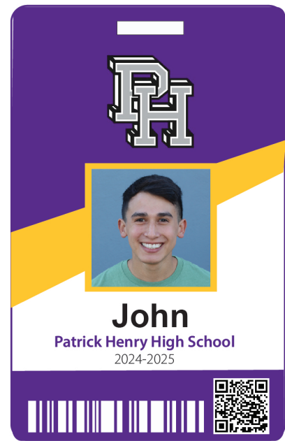
Example of Student ID. Each ID is color-coded by school and has the student's first name, photo, bar code, and QR code.